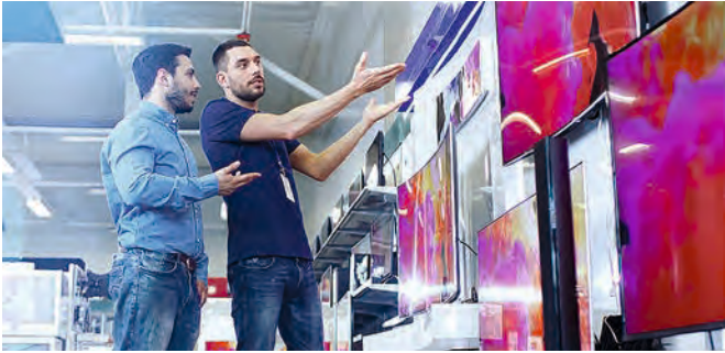
Team: Gemeinsam fällt die Kaufentscheidung leichter

In einer Welt des Überflusses fallen Kaufentscheidungen oft schwer. Verbraucher haben die Qual der Wahl und suchen nach Orientierung. Immer beliebter wird dabei das Internet mit Vergleichsportalen und sozialen Medien. Konsumenten fühlen sich durch Influencer gut informiert, fand eine Studie der Berliner Plattform Influry heraus. 29 Prozent der Befragten gaben hier an, dass Produkte, die im Internet empfohlen werden, besonders glaubwürdig sind. Damit liegen Influencer im Glaubwürdigkeitsranking aber immer noch weit hinter den Empfehlungen von Freunden mit 63 Prozent Nennungen. Das Gespräch im sozialen Umfeld – ob im Job, am Familientisch, im Verein oder auf der Party – ist für Anbieter von Produkten und Dienstleistungen also immer noch die beste Werbung.